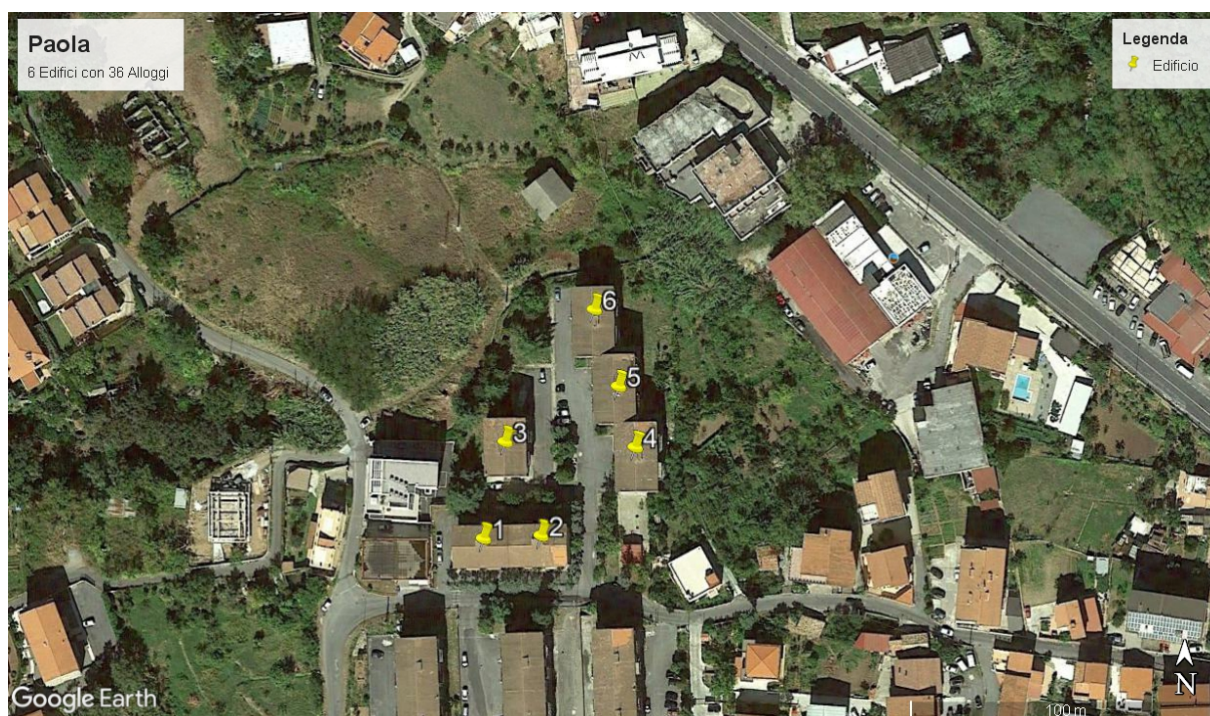
Figura 1- Individuazione del lotto d'intervento