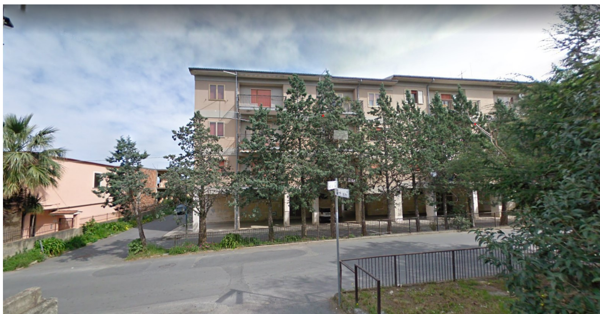
Figure 3, 4 - Edifici oggetto di intervento