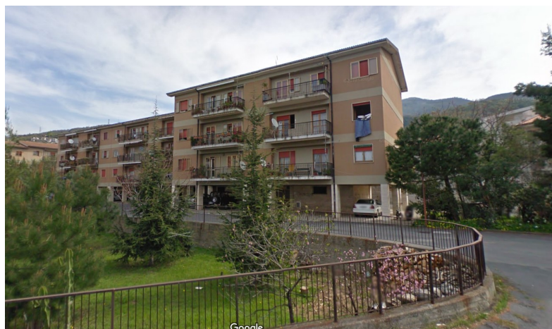
Figure 3, 4 e 5 - Edifici oggetto di intervento