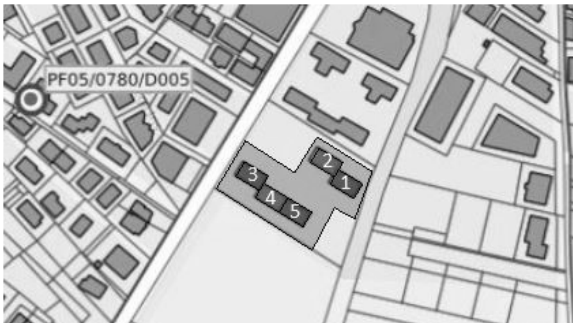
Figura 2- Complessi edilizi oggetto di intervento