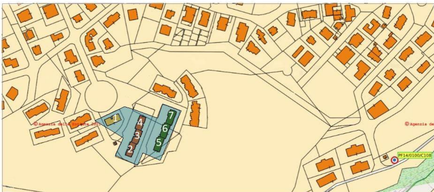
Figura 2 - Complessi edilizi oggetto di intervento