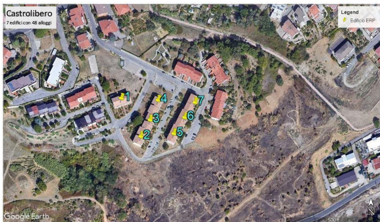
Figura 1- Individuazione del lotto d'intervento