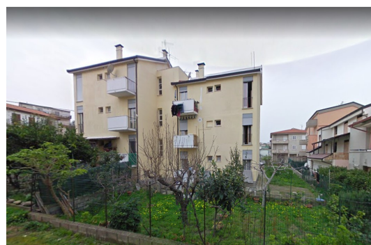
Figura 3, 4 e 5 - Edifici oggetto di intervento