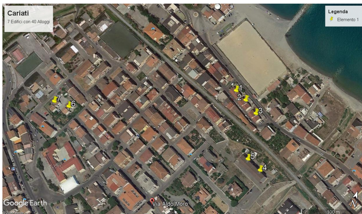
Figura 1- Individuazione del lotto d'intervento