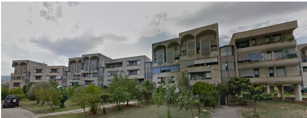
Figure 3 - Edifici oggetto di intervento