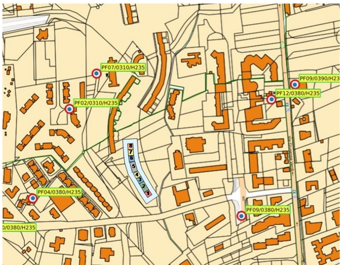
Figura 2- Complesso edilizio oggetto di intervento