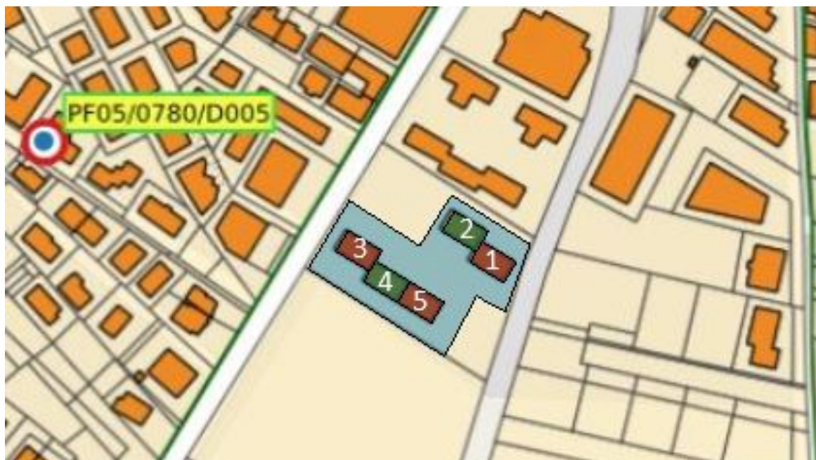
Figura 2- Complessi edilizi oggetto di intervento