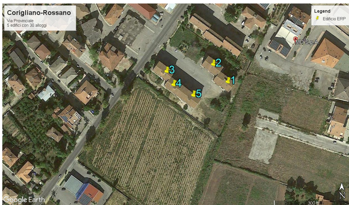
Figura 1- Individuazione del lotto d'intervento