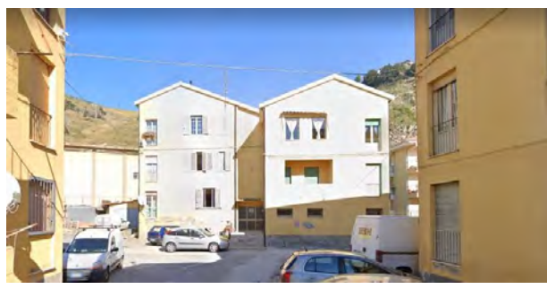
Figure 3, 4, 5, 6, 7, 8, 9 e 10 - Edifici oggetto di intervento