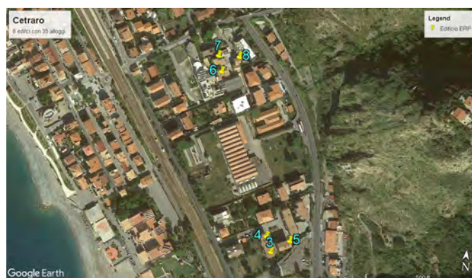
Figure 1, 2 e 3- Individuazione del lotto d'intervento