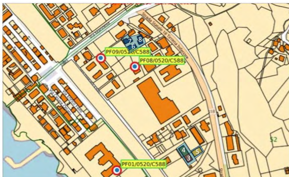
Figure 4 e 5- Complessi edilizi oggetto di intervento