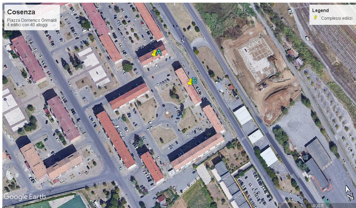
Figura 1 Individuazione del lotto d'intervento