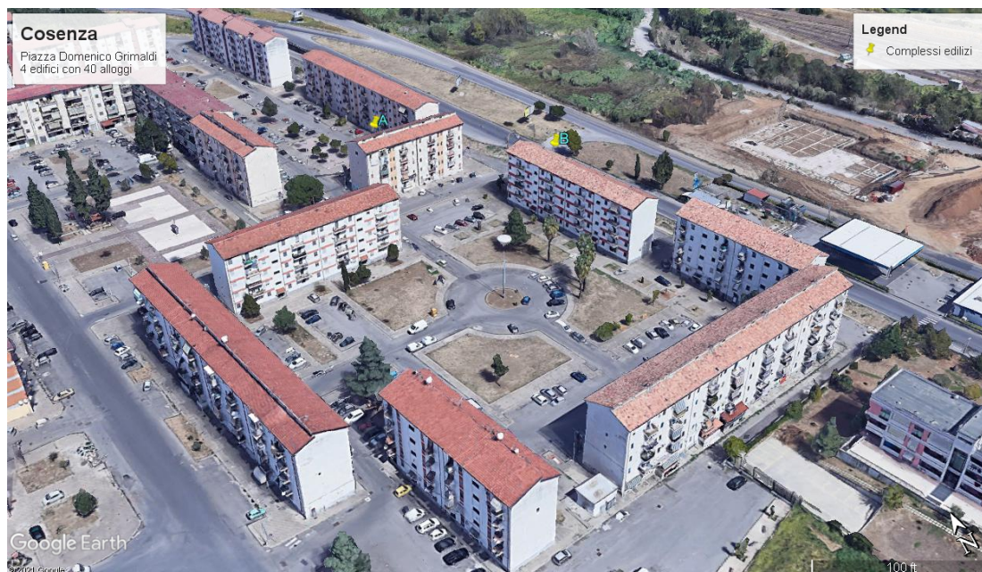
Figura 3 Edifici oggetto di intervento