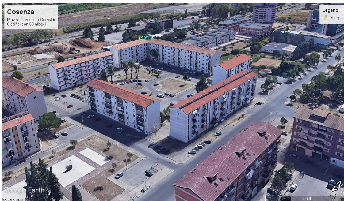
Figura 3 Complesso edilizio del lotto d'intervento