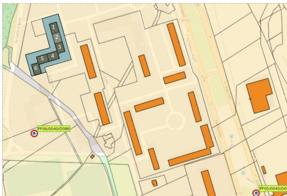
Figura 2 Complesso edilizio oggetto di intervento