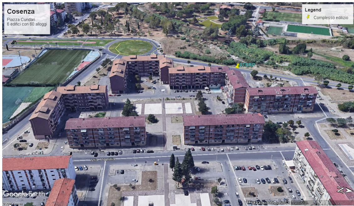
Figura 3 Complesso edilizio del lotto d'intervento