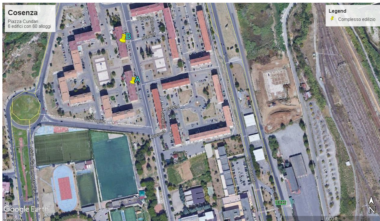
Figura 1 - Individuazione del lotto d'intervento