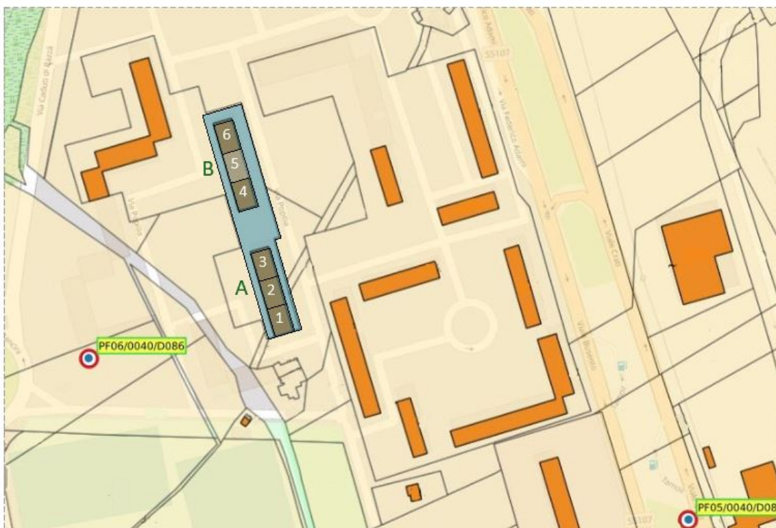
Figura 2 - Complessi edilizi oggetto di intervento